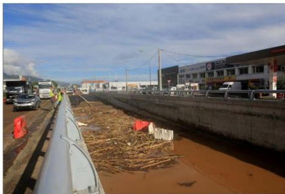
Intempéries en région bastiaise le 24 novembre 2016, le centre commercial et le Géant de Furiani avaient été dévastés.