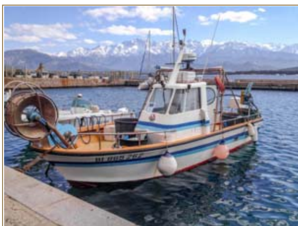
Aide à la remotorisation

Part FEP 491 314,95€ -> Part OEC 731 981,33€