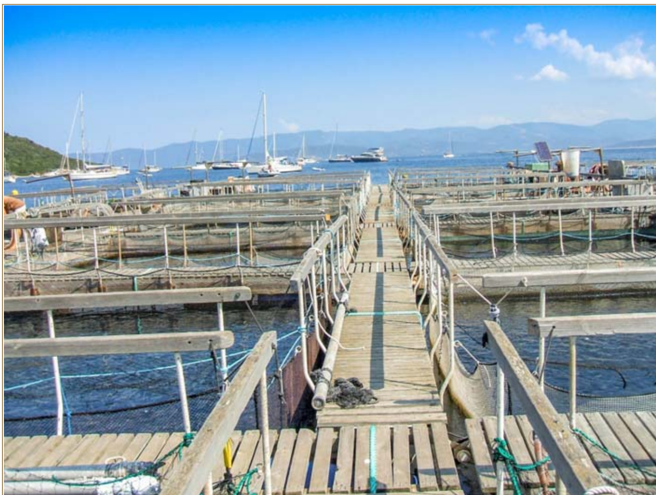
Ferme marine de Campomoro

Le PO FEP Corse affiche 5 axes de développement pour la période 2007-2013. Il représente une enveloppe financière pour la Corse de 2 871 265 euros .