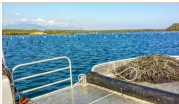
Etang de Diana

Une vingtaine de dossiers ont été traités concernant des modernisations d'entreprises conchylicoles, l'augmentation de production des entreprises piscicoles et la création ou la modernisation d'entreprises de mareyage.