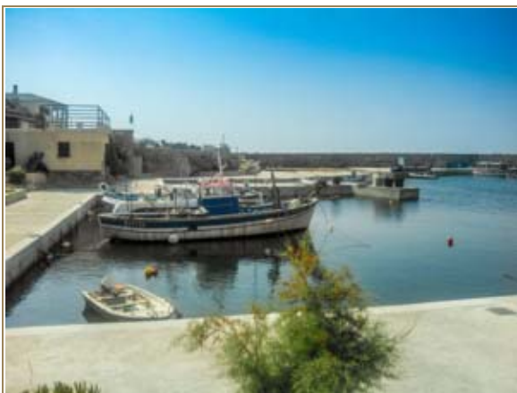
Invest dans les Ports de Pêche - Port de Centuri

On dénombre 17 opérations collectives structurantes au titre de l'Axe 3 :