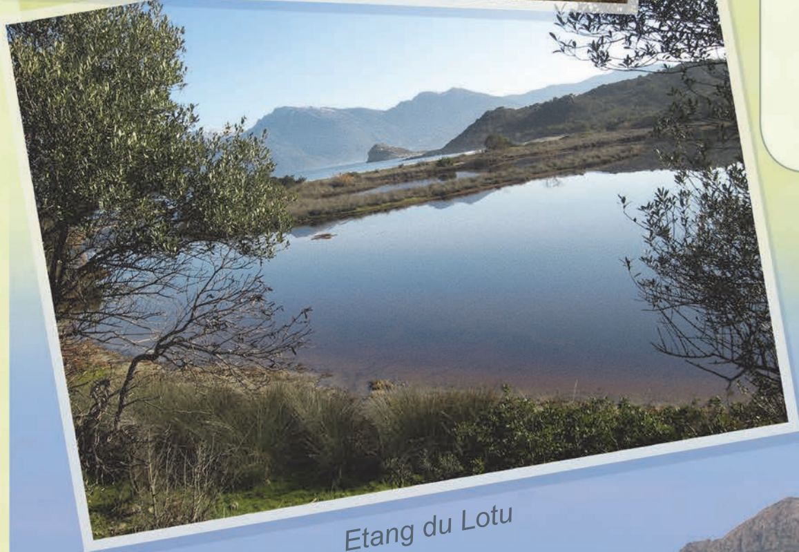
Etang du Lotu

Le Fiume Santu, le Liscu et l'Ostriconi sont les cours d'eau majeurs formant de remarquables embouchures. De nombreux étangs, Ghignu, Lotu et Panecalellu, ponctuent les dunes en arrière des plages et constituent des écrins de biodiversité, qui s'expriment également dans les marais de Saleccia. La végétation y est caractéristique des zones humides salées ou d'eau douce (salicornes, joncs, saules ...) et des oiseaux sédentaires ou migrateurs y trouvent refuge.