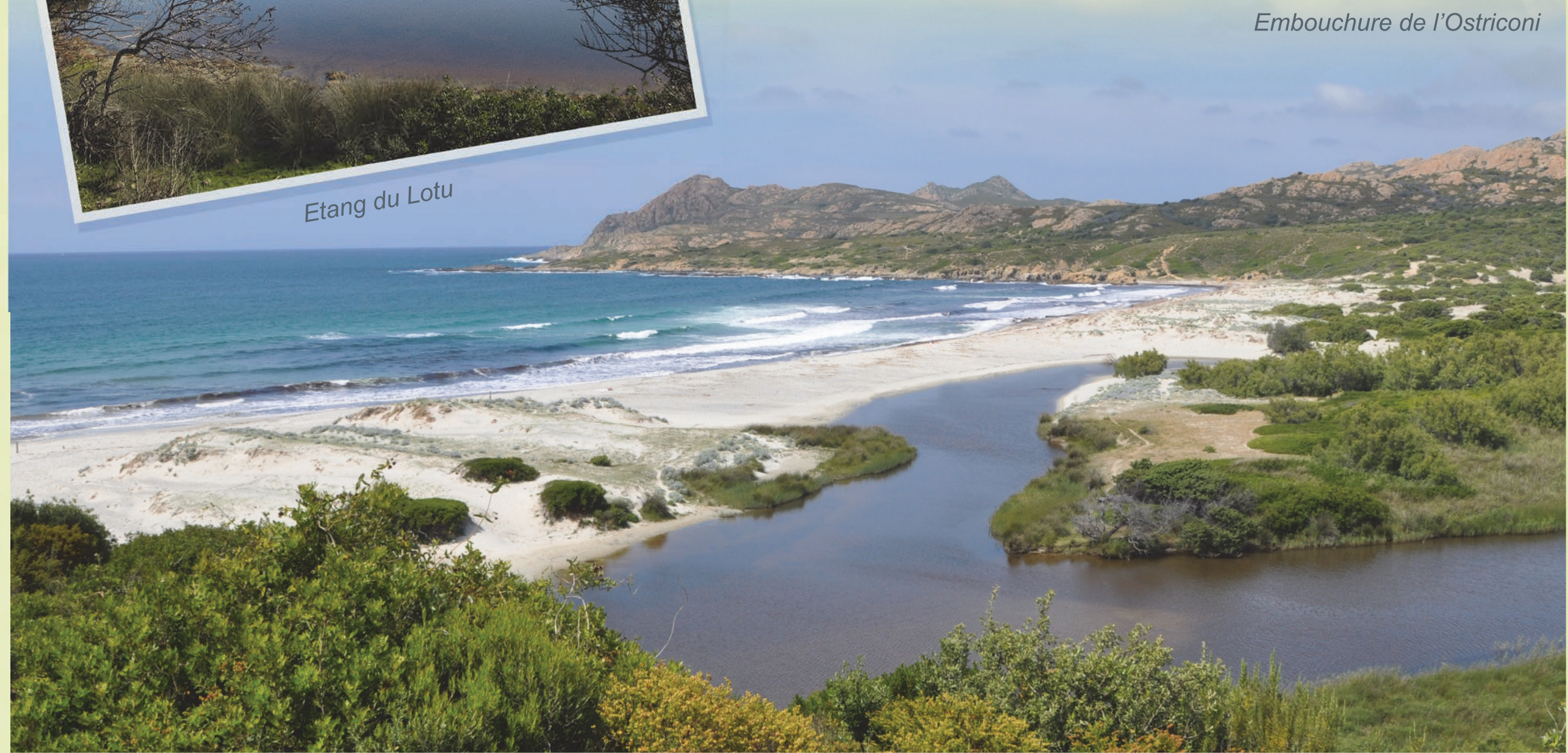
Embouchure de l'Ostriconi

Dans l'intérieur, d'autres milieux humides, moins connus que les précédents, constituent des écosystèmes singuliers, d'une grande valeur patrimoniale. Ce sont les mares temporaires méditerranéennes . Ces petites zones humides, peu profondes (20 à 60 cm) et caractérisées par une alternance de phases sèches et inondées, présentent un cycle hydrologique intimement lié aux fluctuations du climat méditerranéen. Ainsi, elles sont inondées de la fin de l'automne à la fin du printemps par de l'eau douce issue des précipitations et s'assèchent dès le mois de mai essentiellement par évaporation.