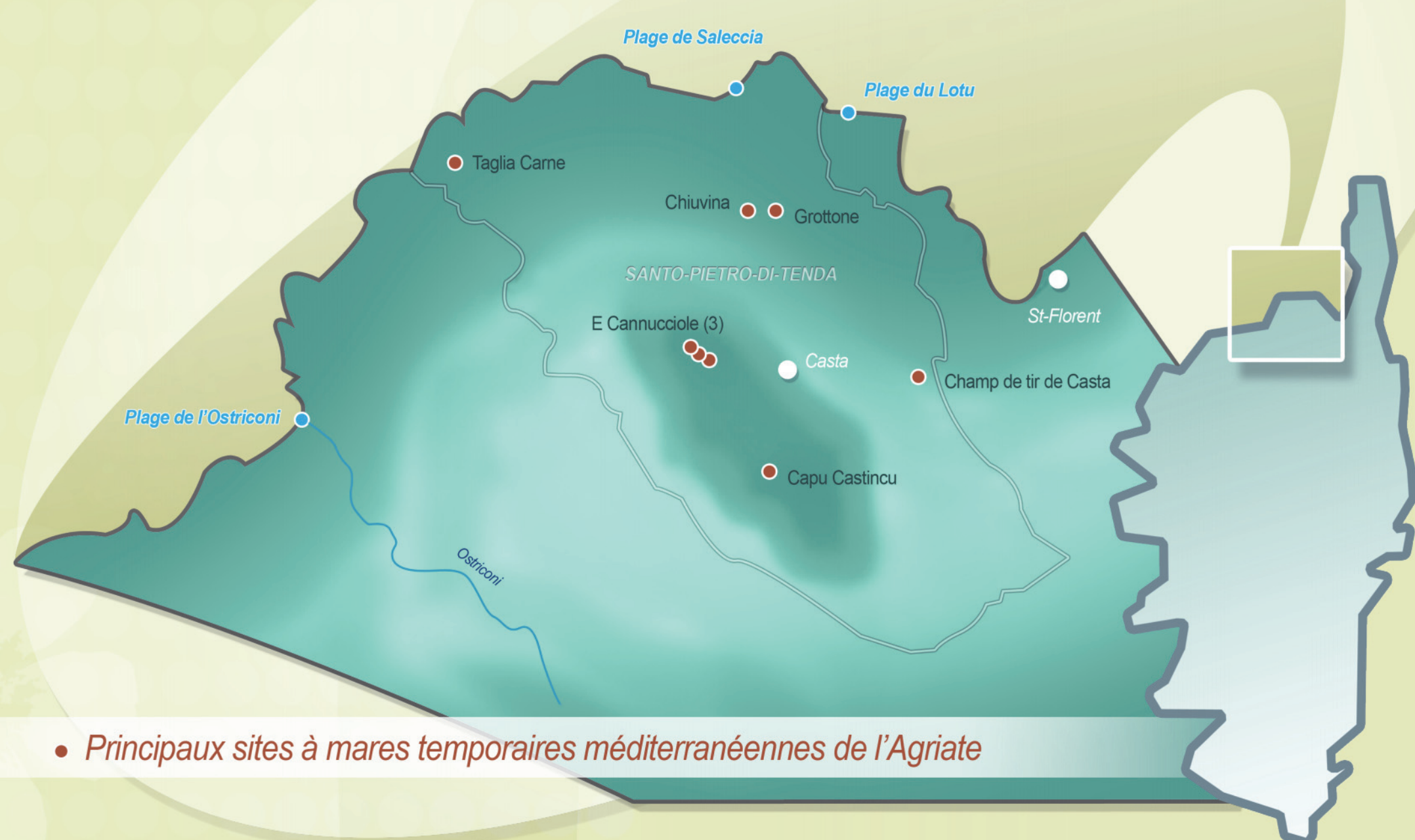
• Principaux sites à mares temporaires méditerranéennes de l'Agriate

La Corse compte une cinquantaine de sites à mares temporaires répartis dans 5 microrégions (Cap Corse, Agriate, Sartenais, Porto Vecchio et Extrême Sud). Très bien représentées dans le Sud de l'île, elles se rencontrent également dans l'Agriate où l'on recense 6 principaux sites localisés sur la commune de Santo Pietro di Tenda.