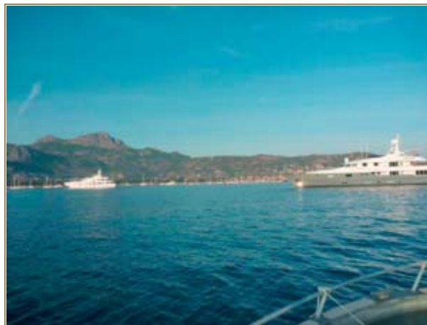
Grande plaisance dans la baie de calvi