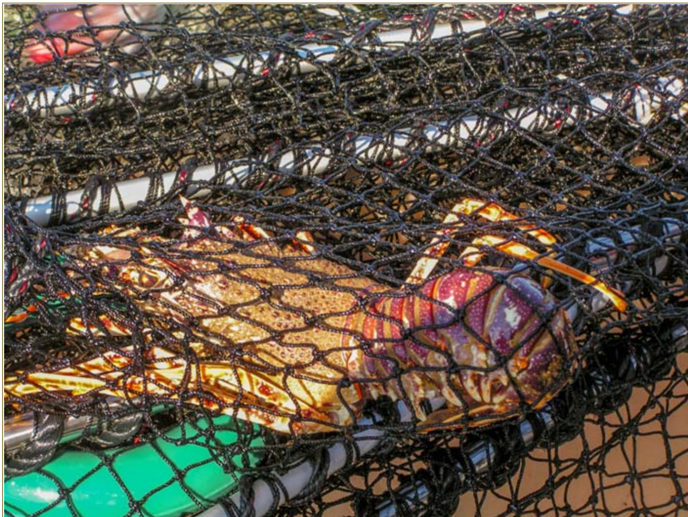
Langouste prise dans une nasse

La langouste rouge Palinurus elephas est un crustacé de grande importance économique en méditerranée. En 1956, Doumenge décrivait déjà cette pêche comme étant la plus rémunératrice et la plus régulièrement pratiquée sur le littoral rocheux de la Corse (300 tonnes par an à l'époque). On observe aujourd'hui une baisse des productions qui semble imputable à une érosion du stock.